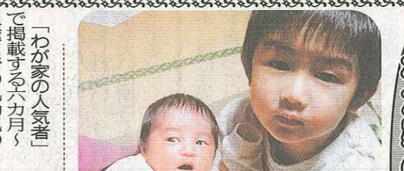
「わが家の人気者」で掲載する六カ月〜三歳までの乳幼児の写真募集

「わが家の人気者」で掲載する六カ月〜三歳までの乳幼児の写真募集(兄弟姉妹といっしょの写真も可。名東ホームニュースの配布エリアにお住まいの中日新聞の読者であれば、遠方のお孫さんの写真の掲載も可です)。 住所表示はせず、名無しで名前のみ掲載も可能です。 申し込みはご利用の中日新聞販売店にある専用応募用紙に、メッセージや氏名表記の指示など必要事項を記載の上、写真(サービス判一枚)を添えて販売店へ提出するか、〒465-00057名東