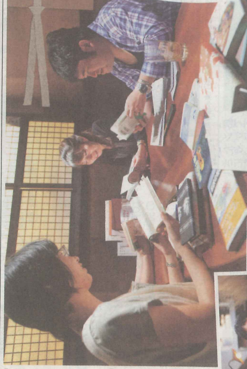
「一冊に絞りきれない」という本々本々が、こう

● 個人情報保護に関するお問い合わせは、個人情報保護推進事務局 ☎075(257)6504(8日を除く月曜～金曜、午前10時～午後5時)