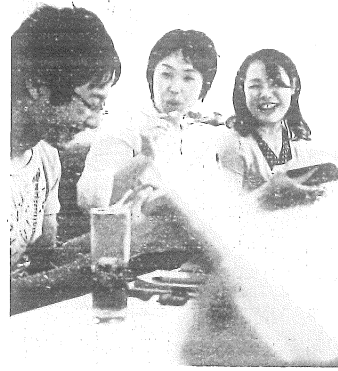
マンガ本を手に、印象に残ったシーンやセリフについて話し合う記者(中央)＝東京都内で、源幸正倫撮影

読書会 は欧米でも人気だ。アメリカでベストセラーとなつた小説「ジェーン・オースティンの読書会」は、読書会に参加する男女6人の物語だ。この小説の翻訳者でアメリカ在住経験もある矢倉尚子さんによる「アメリカで、読書会」は中高年女性の多くが何らかの読書会に参加している、と言われていると話す。働く女性が多いため、夜、メンバーの自宅に集まり、お酒などを飲みながら本について語り合う例が多いという。